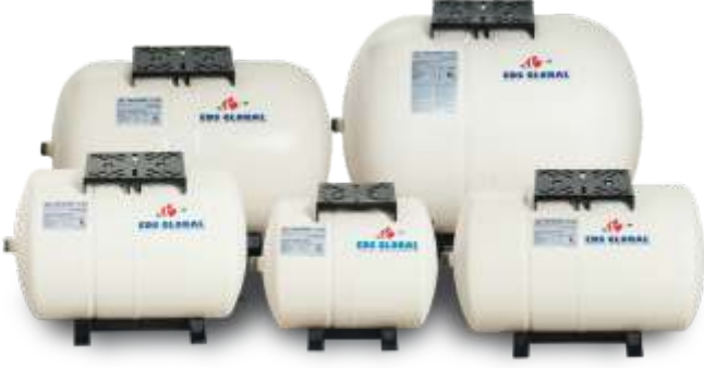
Horizontal Tanks Yatık Tanklar