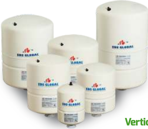
Vertical Tanks Without Leg Dik Ayaksız Tanklar