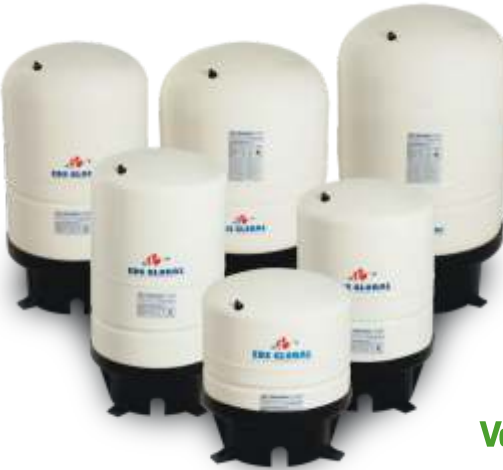
Vertical Tanks with Leg Dik Ayaklı Tanklar